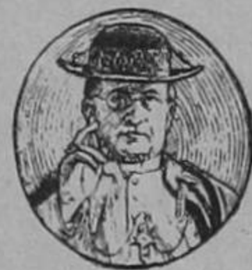
Su Santidad el Papa Pío XI

«Ha sido tan grande la impresión que causó en la Cámara la Encíclica última del Papa sobre las causas de los presentes males económicos, que todos sin excepción, aprobaron la proposición presentada por el senador de Lousiana, de que se imprimiese dicha Encíclica entera en el Registro de las Actas del Congreso. Al hacer la proposición mencionada, el Senador leyó el siguiente extracto de la Encíclica en que el Sumo Pontífice señala valientemente las terribles consecuencias de la codicia y avaricia: «De la codicia procede la mutua desconfianza que todo lo destruye y esteriliza; de la codicia nace esa enconada envidia que presenta las ganancias ajenas como pérdidas propias; la codicia produce ese estrecho individualismo que ordena y subordina todo el provecho propio sin tomar en cuenta el de los demás.»